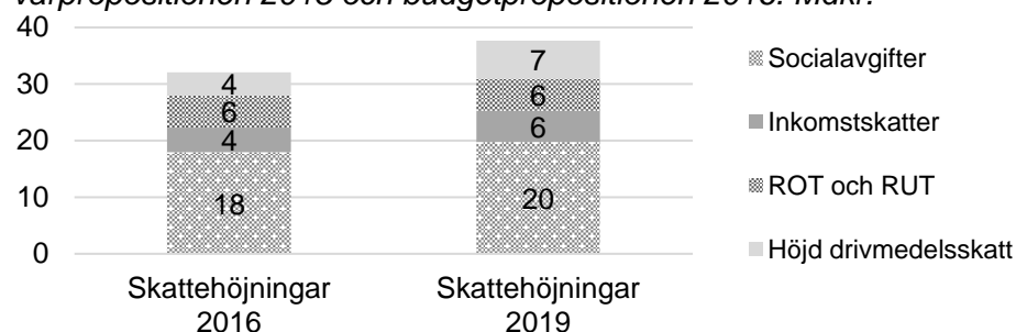
Tabell 5: Skatte- och avgiftshöjningar som slår mot företagande och arbete i vårpropositionen 2015 och budgetpropositionen 2016. Mdkr.